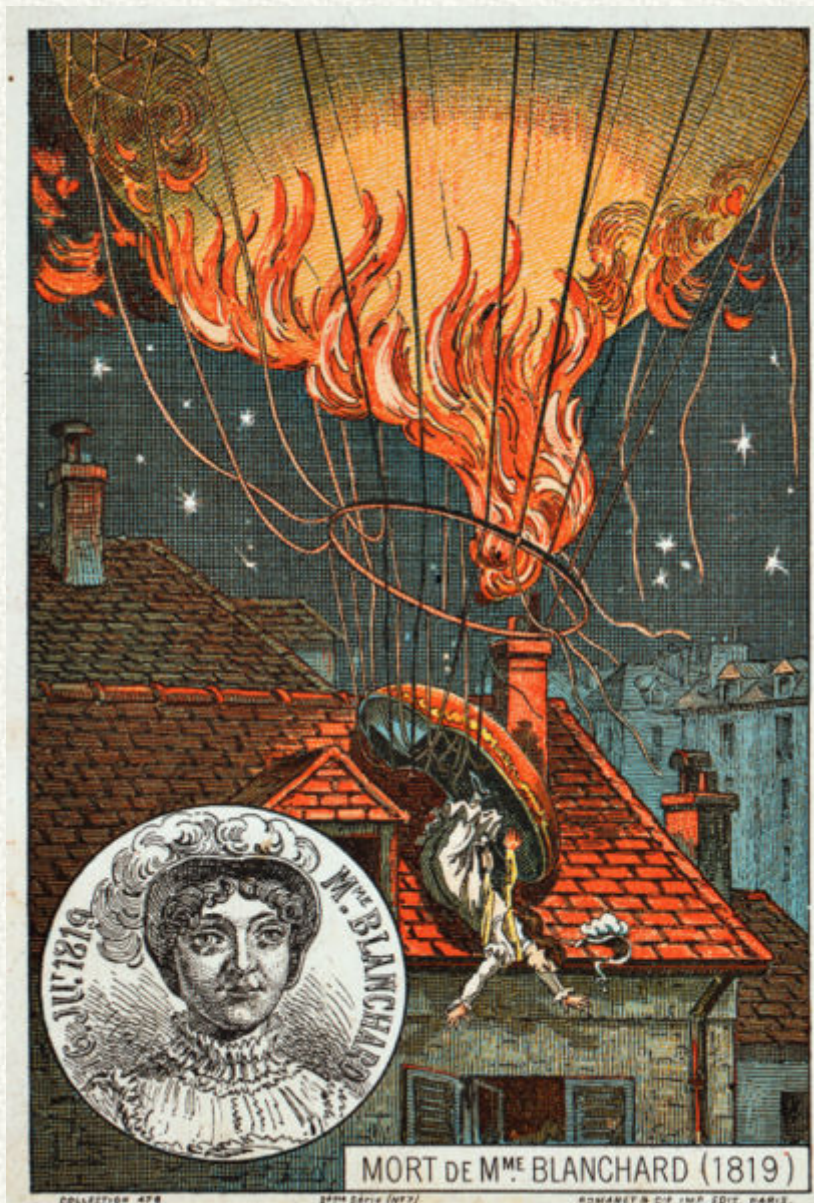
Cartolina illustrativa della morte di Madame Blanchard.

Il coraggio di Sophie e Jean Pierre Blanchard avevano aperto la strada alla storia della conquiste e delle conoscenze del cielo.