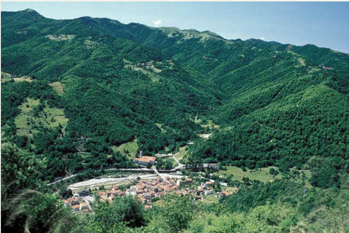
Figura 3 - Panorama di Montebruno e dintorni dall'alto con l'attraversamento del fiume Trebbia. Così sarebbe apparso a Sophie questo bel paesaggio quando arrivò dal cielo il 16 Agosto. Peccato però perché non ebbe modo di vederlo in quanto arrivò di notte. In alto il celebre Santuario, eretto in seguito all'apparizione della Madonna nel 1478, ed il ponte romano

Grande fu lo stupore allorquando, alle prime luci dell'alba, contadini e pastori ebbero la visione di questo particolare oggetto impigliato tra gli alberi. La meraviglia dei primi che arrivarono fece presto adunare la gente da tutto il paese accorsa per vedere quello strano oggetto con una creatura femminile venuta dal cielo. In fondo era già successo qualcosa di simile, anche se in forma diversa.