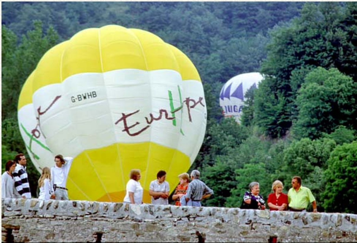
Mongolfiere a Montebruno durante la manifestazione annuale.