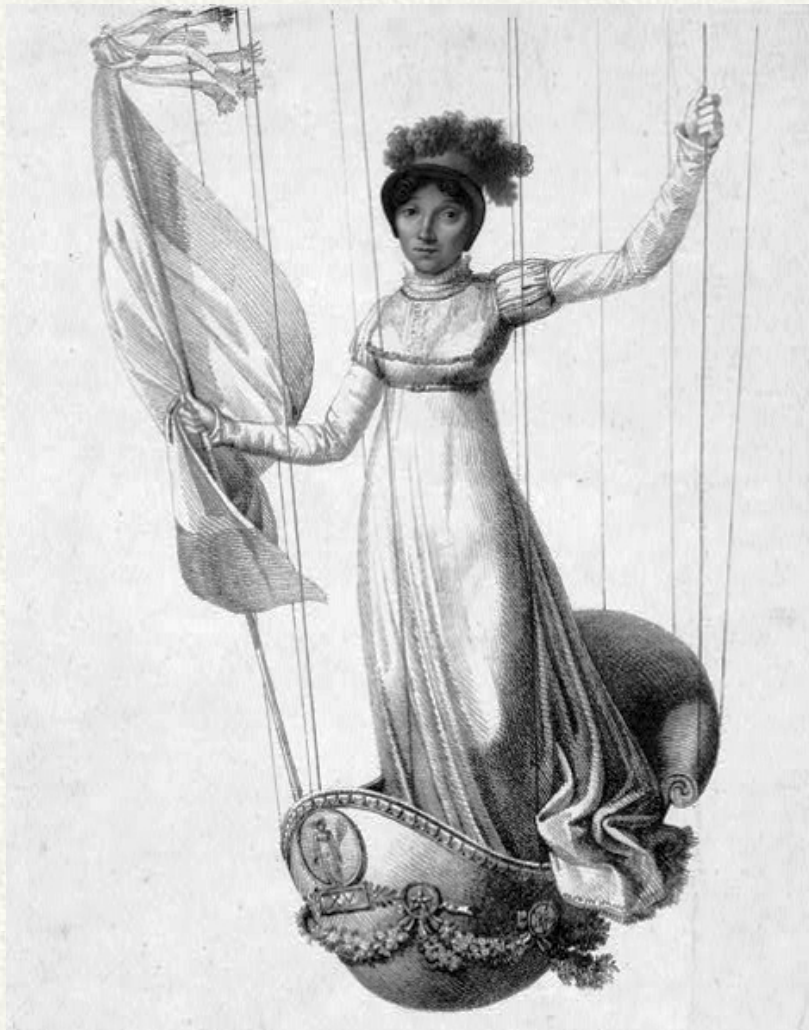
Figura 1 - Sophie Blanchard durante l'ascensione sopra Milano il 15 agosto 1811, il giorno del 42° compleanno di Napoleone Bonaparte. Immagine di Luigi Rados (dalla United States Library of Congress. L'immagine è messa a disposizione ed è pubblicabile in quanto di pubblico dominio perché il relativo diritto d'autore è scaduto).

La storia di una delle prime viaggiatrici dei cieli e l'influenza del tempo atmosferico su quella che doveva essere una breve ascensione dimostrativa a Milano, che diventa invece un viaggio dalla Pianura al Mare, attraverso gli Appennini Liguri, con atterraggio a Montebruno