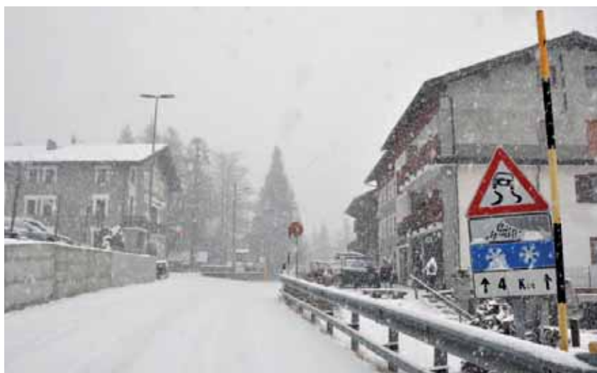
Un netto cambiamento di configurazione atmosferica si verifica il 02.01.2016, quando transita una saccatura atlantica e avvengono le prime spruzzate di neve dell'inverno non solo sulle Alpi ma anche su parte della Valpadana. Sopra, rovescio nevoso nel pomeriggio a Ceresole Reale (Gran Paradiso) al passaggio del fronte freddo. La stazione ARPA Piemonte di loc. Villa (1581 m) segnala T min -4,1 °C, T max 2,1 °C e 15 cm di neve fresca a fine evento.

Il dominio delle alte pressioni che tra novembre e dicembre 2015 ha mantenuto tempo straordinariamente tiepido e secco si interrompe momentaneamente a inizio gennaio 2016. Intanto il gelo notturno si intensifica tra San Silvestro e Capodanno sulle regioni italiane orientali, più toccate da una discesa fredda sui Balcani (T min -3,4 °C a Lecce), poi il giorno 2 una perturbazione da Ovest riporta finalmente precipitazioni al Centro-Nord: le pianure occidentali del Piemonte si devono accontentare di una lieve bagnata (2,0 mm di pioggia a Cuneo), 5-15 cm di neve cadono sulle Alpi occidentali oltre i 1000 m, ma più a Est la neve raggiunge a tratti la Pianura Padana soprattutto la sera (1-2 cm tra Piacenza e Reggio Emilia, 2-5 cm dal Milanese al Bresciano), mentre sotto il flusso tiepido dal mare piove intensamente fino a 2000 m sul