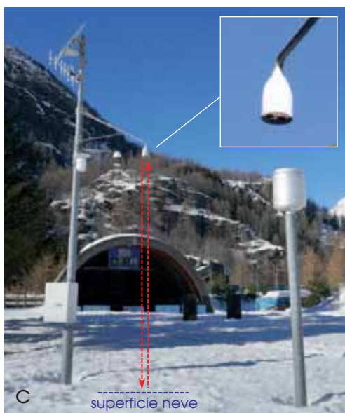
2. Modalità tradizionali e moderne di misura dello spessore nevoso al suolo. (a) Asta nivometrica per la lettura diretta - di solito ogni mattina - dell'altezza neve (Rifugio Fontana Mura, 1726 m, Val Sangone - TO); pressoché tutte le lunghe serie di dati alpini sono costituite da dati osservati in questo modo. (b) Asta nivometrica storica oggi teleosservata tramite webcam per ovviare al cesato presidio sul posto. Adattamento tecnologico che permette (rebbe) di salvare dalla chiusura importanti stazioni di montagna, come avvenuto qui, a Gressoney-D'Ejola (1850 m, M. Rosa, serie utilizzata in questo studio) grazie a una collaborazione tra SMI e Centro Funzionale della Regione Autonoma Valle d'Aosta. (c) Stazione meteorologica automatica ARPA Piemonte con nivometro (Ceresole Reale, 1581 m, Gran Paradiso): l'altezza neve viene dedotta dal tempo di ritorno di ultrasuoni emessi dal sensore e riflessi dalla superficie del manto (tempo più breve = distanza minore = neve più spessa, e viceversa). Apparecchi molto diffusi dagli Anni Novanta, permettono il monitoraggio continuo in zone remote, ma richiedono un'attenta validazione dei dati per rimuovere il rumore di misura (segnali indesiderati) e valori spuri (presenza di erba sotto al sensore, difficilmente distinguibile dal segnale generato da piccole nevicate soprattutto tra la tarda primavera e l'autunno).

snow season has shortened in the range of 20-30 days below 2000 meters since 1971. The negative trends can be mostly explained by the rising temperature and the related shift from solid to liquid precipitation.